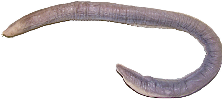
Figura 1 – Myxine sotoi . NPM 1862, 516 mm CT.