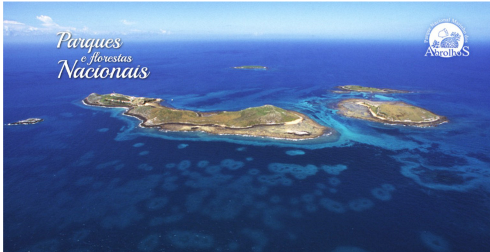
Figura 3 – PARNA Marinho de Abrolhos.

O PARNA abriga um complexo de recifes coralíneos, região com maior biodiversidade marinha do Atlântico Sul. Suas belas paisagens, cavernas submarinas , a presença das baleias Jubarte que vêm acasalar e dar à luz na região, suas aves marinhas , entre outros atributos, atraem turistas e pesquisadores do mundo todo para atividades como mergulho, observação de fauna e atividades científicas . Pronta para receber visitantes, o PARNA conta com um centro de visitantes, guias capacitados pelo ICMBio, trilhas e um conjunto de unidades de conservação em seu entorno (ICMBio 2018).