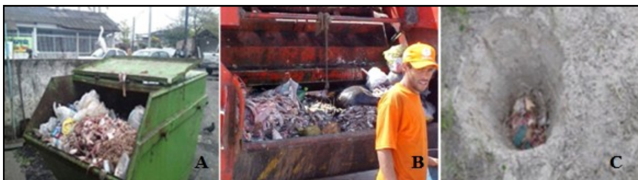
Figura 2. Destinação atual de rejeitos em três mercados de peixes no litoral do Paraná: A: depositados temporariamente em caçamba, centro de Matinhos; B: recolhidos por caminhão de lixo, Brejatuba-Guaratuba; C: enterrados em cova na área de restinga, Balneário Shangrilá.

II. Uso em artefatos de couro. A pele do pescado pode ser curtida para produção de bolsas, botas, carteiras, móveis, etc. O aproveitamento dos resíduos requer cuidados na extração, pressupondo capacitação do pessoal de processamento, e logística de armazenamento e recolhimento para curtume central na região, este um investimento elevado. Uma alternativa de menor custo imediato é o estabelecimento de um acordo comercial para utilização de curtume já instalado em outra região.